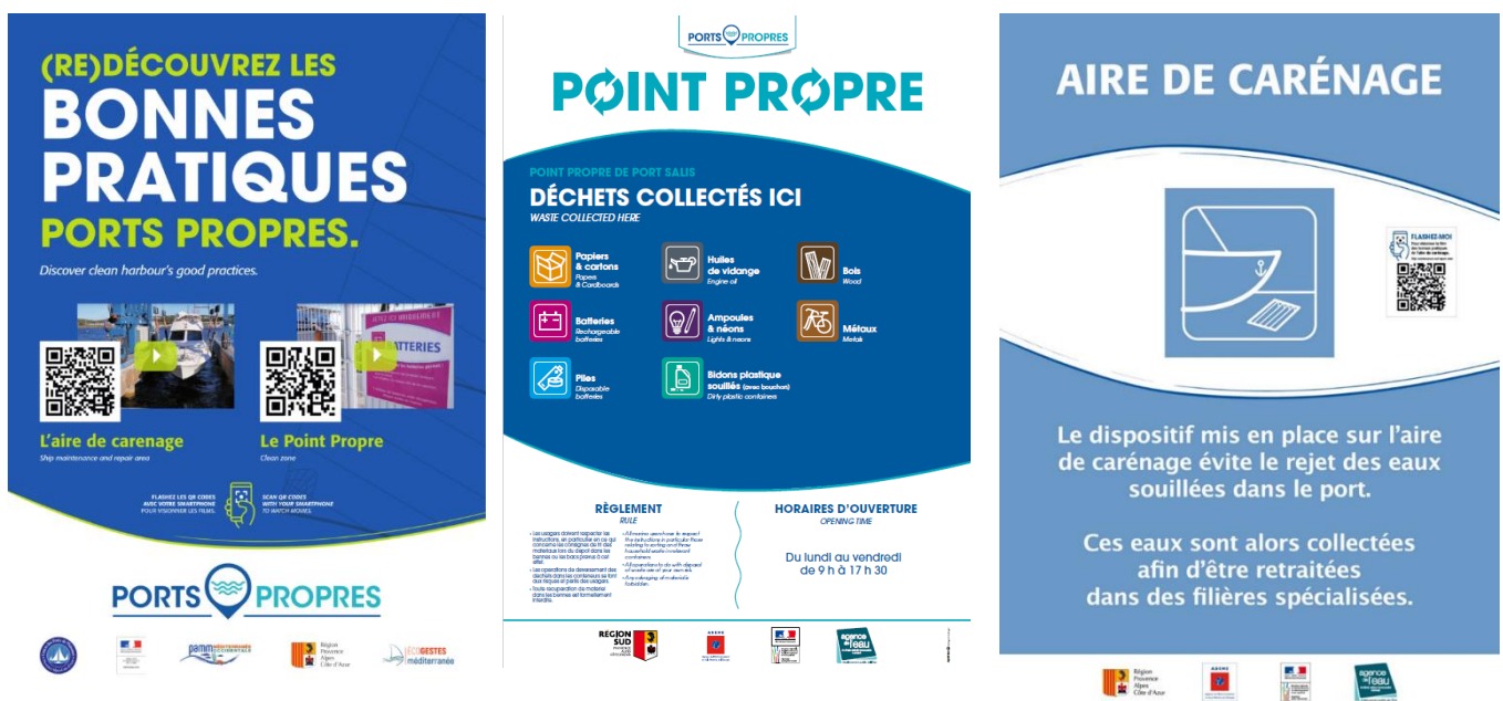
Affiches et QR code sur signalétiques Ports Propres pour visionner les films

Pour remarque, l'Union des Ports de Plaisance Provence Alpes Côte d'Azur et Monaco avec le concours des institutions a réalisé de deux films pédagogiques de courtes durées sur « Ports Propres ». Ils présentent l'utilisation de l'aire de carénage et du point propre et seront diffusés dans les capitaineries. De plus, des QRcodes sur divers supports (affiches, autocollants sur les équipements...) permettent leur visionnage sur les smartphones des usagers. Les ports disposant d'un point propre et d'une aire de carénage et, de la signalétique « Ports Propres », peuvent bénéficier de ces outils de sensibilisation et d'information.